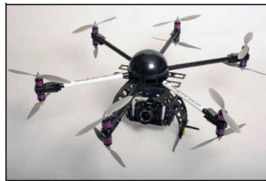
Вертолетного типа (многомоторные)